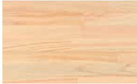
桧集成材 (上小無地)