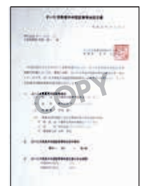
さいたま県産木材認証事業者認定書