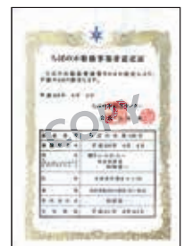
ちばの木取扱事業者認定証