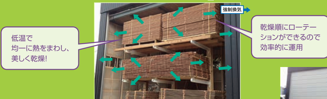
→ は空気の対流イメージです。