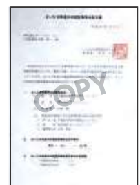
さいたま県産木材認定事業者認定書