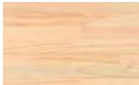
桧集成材(上小無地)