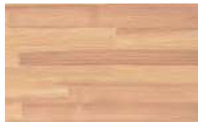
杉集成材(上小無地)

『地産地消』がうたわれている中で木材もそれぞれの地域における地元産の材料の消費がもとめられています。 (株)ティ・エス・シーでは各県の県産材を利用したカウンター・階段・枠材など 室内装飾用としての地元産の活用を巾広く求めています。