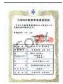
ちばの木取扱事業者認定証