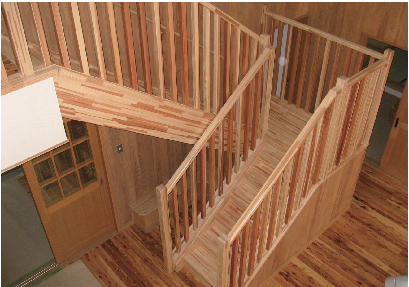
※この頁の写真は施工例です。