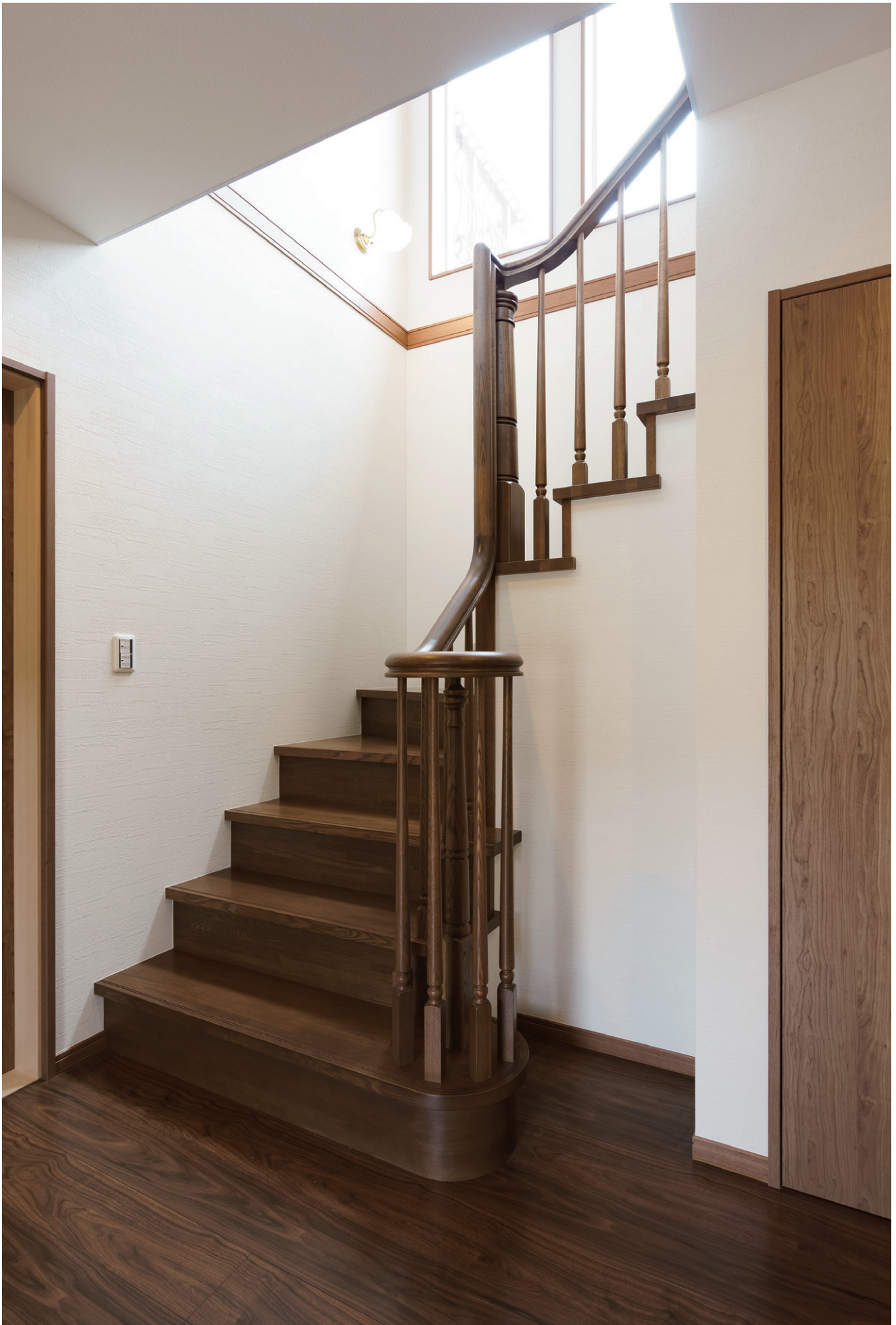
※この頁の写真は施工例です。