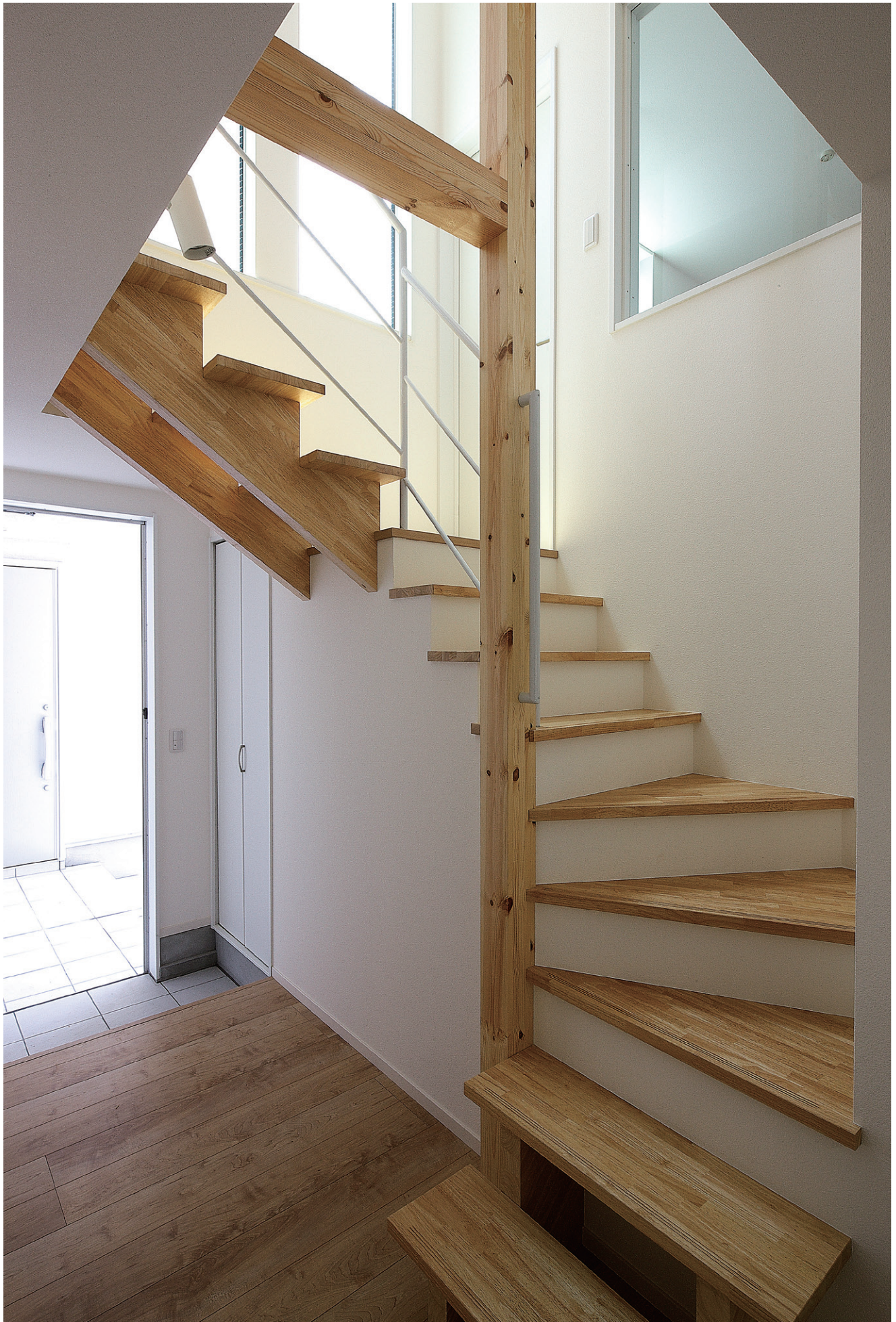
※この頁の写真は施工例です。