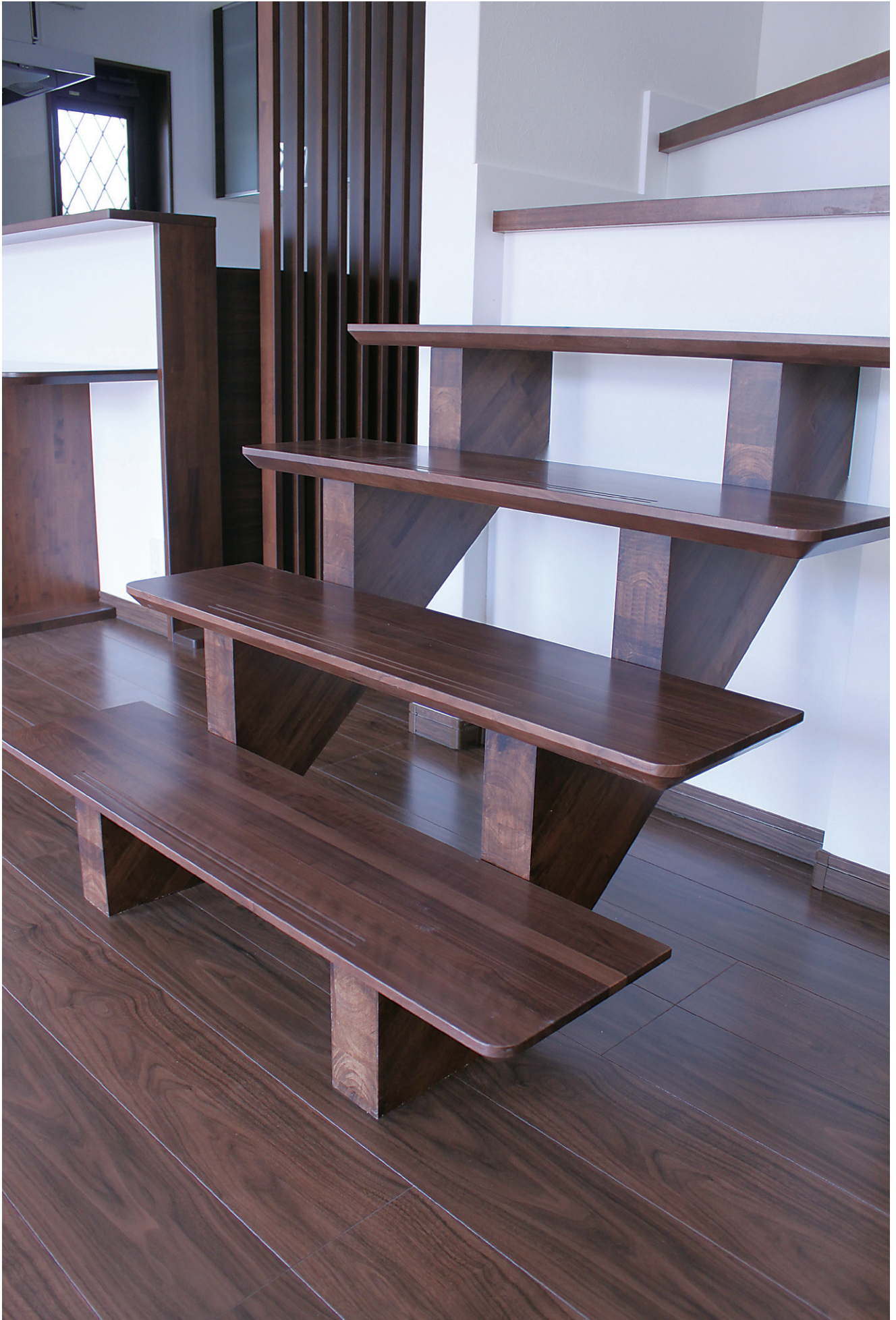
※この頁の写真は施工例です。