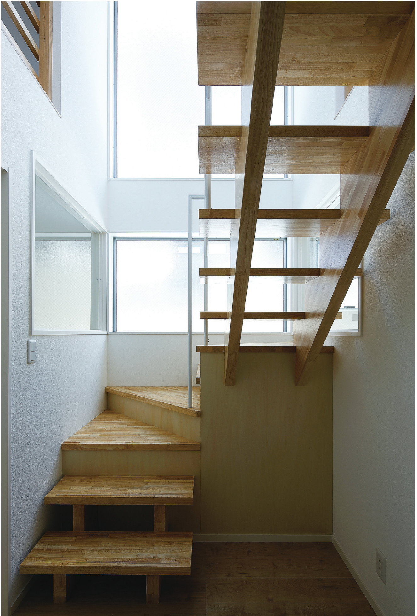
※この頁の写真は施工例です。