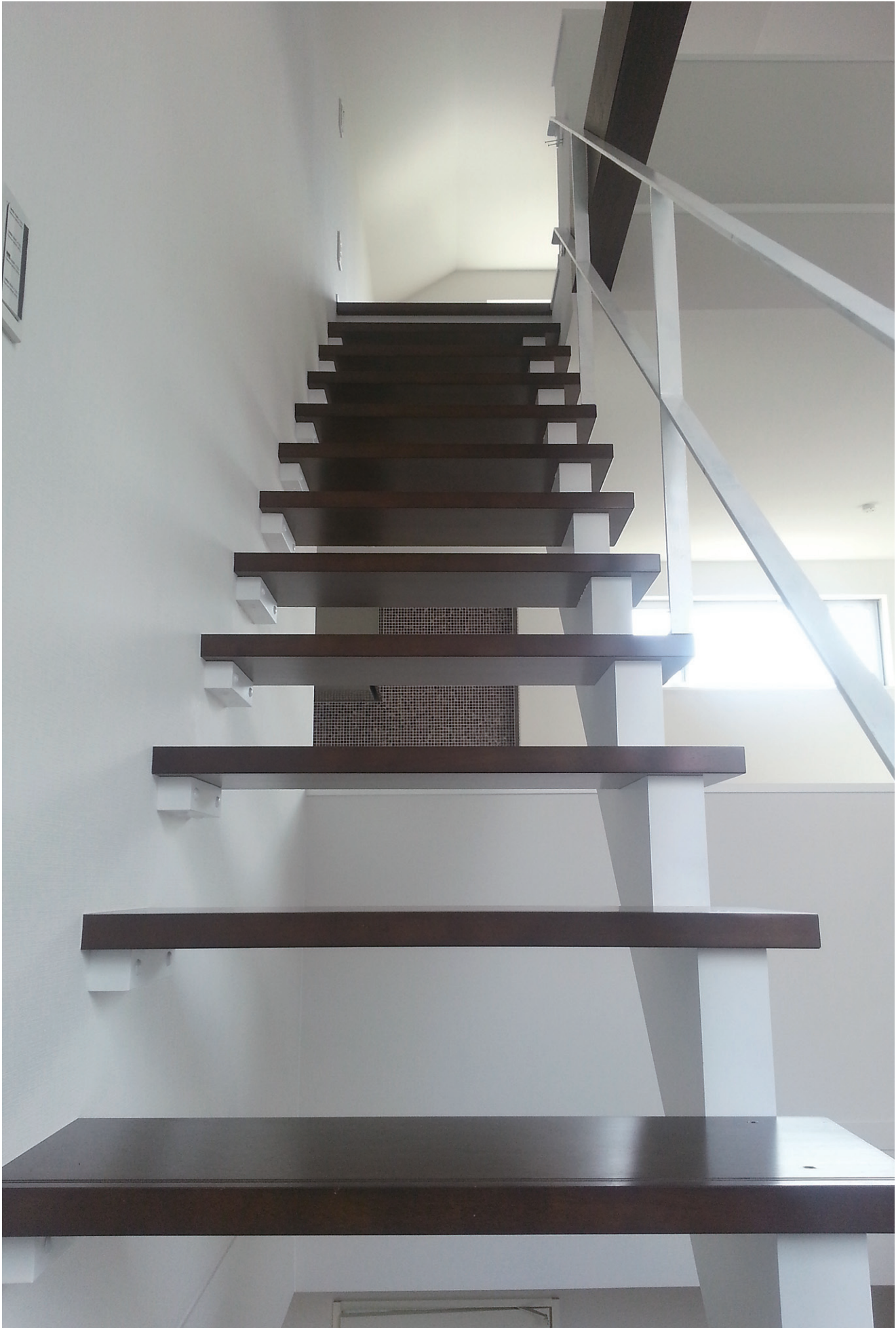
※この頁の写真は施工例です。