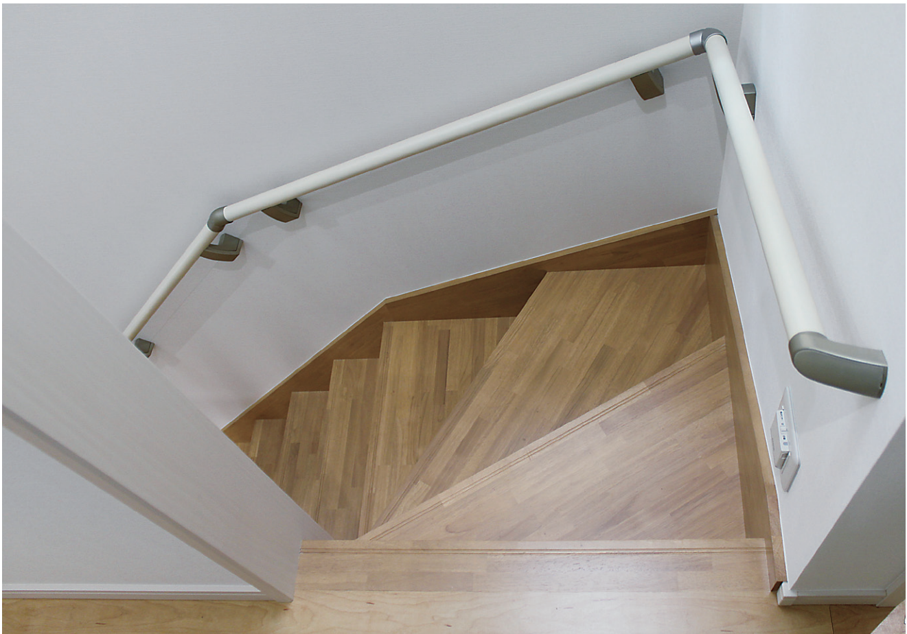
※この頁の写真は施工例です。