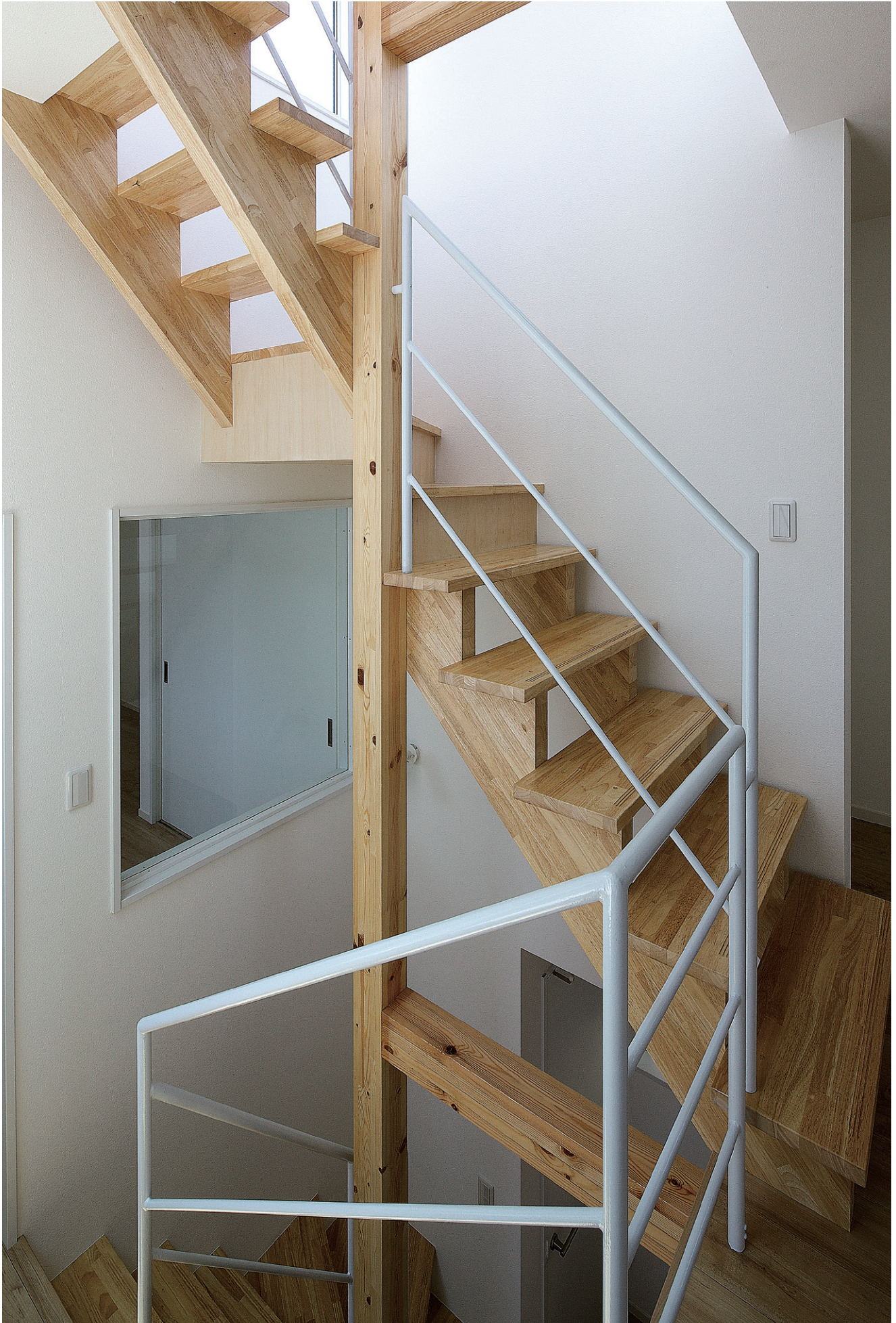
※この頁の写真は施工例です。