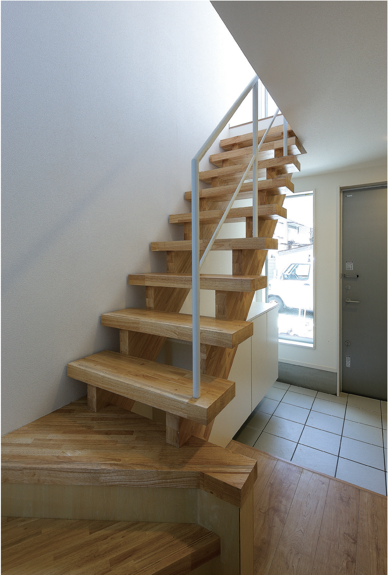
※この頁の写真は施工例です。