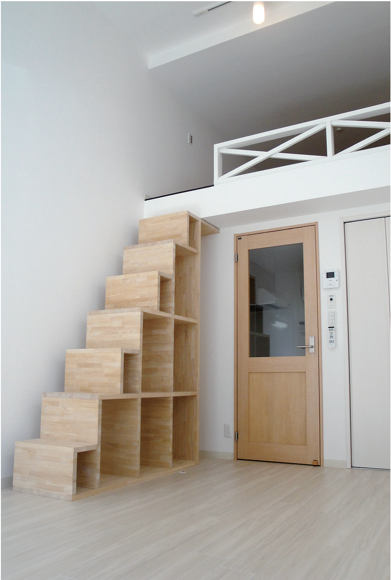
※この頁の写真は施工例です。