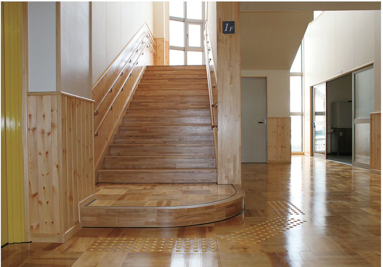
※この頁の写真は施工例です。