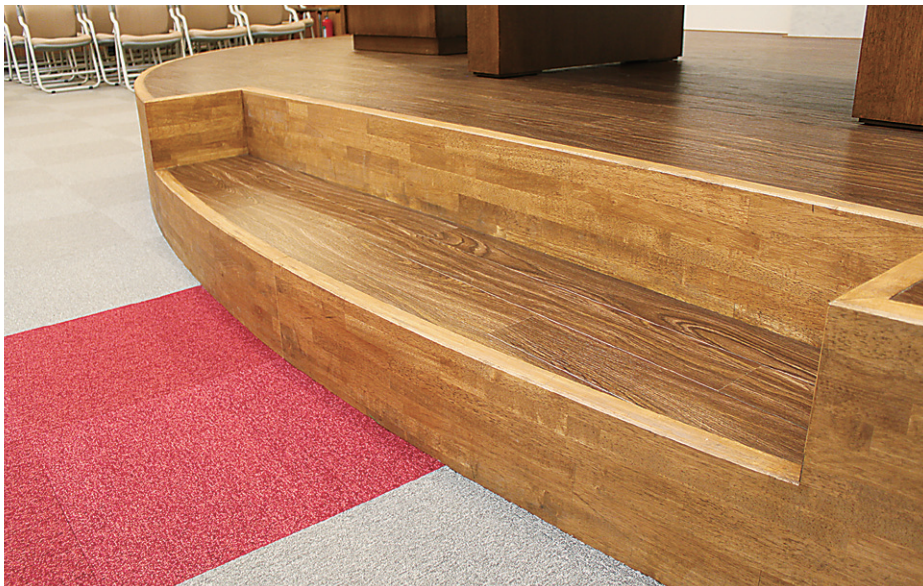
※この頁の写真は施工例です。